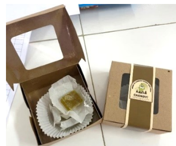
Gambar 1. Permen jeli kombucha daun sirsak yang telah dikemas

Bahan utama pembuatan permen jeli adalah kombucha daun sirsak. Selama pembuatan kombucha, terjadi proses fermentasi sukrosa oleh mikroorganisme yang menghasilkan asam organik, yang menurunkan pH larutan (Saputra dkk., 2017).