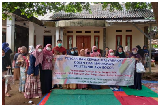
Gambar 6. Dokumentasi peserta pelatihan pembuatan hand sanitizer