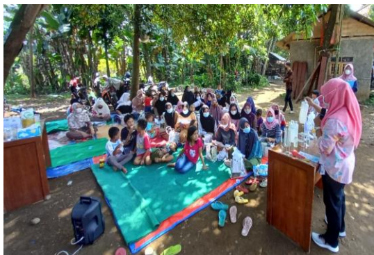
Gambar 4. Pelatihan Pembuatan Hand Sanitizer

Dalam pelatihan pembuatan hand sanitizer berbahan alami digunakan peralatan sederhana dan bahan yang mudah diperoleh sehingga masyarakat dapat membuat hand sanitizer dalam skala rumah tangga sehingga berpotensi membuka lapangan kerja baru. Kandungan alkaloid, flavonoid, fenol, tanin, dan vitamin C dapat berfungsi sebagai antioksidan (Harahap dkk., 2021). Hasil penelitian Sakti (2022) menunjukkan bahwa kulit lemon memiliki kemampuan aktivitas penangkap radikal bebas dan tabir surya sehingga mampu membantu melindungi kulit dari bahaya sinar matahari. Kandungan saponin, flavonoid, polifenol, serta tanin dalam aloe vera menyebabkan tanaman yang banyak dibudidayakan ini memiliki manfaat sebagai antiseptik dan pelembab kulit (Dewi, 2016). Pelatihan pembuatan hand sanitizer dapat dilihat pada Gambar 4.