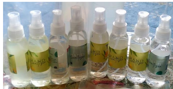
Gambar 5. Produk Hand Sanitizer Hasil PkM

sanitizer berbahan alami. Warna, tekstur, dan aroma hand sanitizer yang dihasilkan sedikit berbeda karena pemilihan pewangi yang digunakan. Hand sanitizer terstandar yang diperoleh tidak berwarna dan tidak lengket di tangan sedangkan hand sanitizer berbahan alami agak keruh karena pengaruh warna kulit lemon yang digunakan namun memiliki aroma yang menyegarkan. Salah satu upaya untuk memperbaiki warna hand sanitizer yang diperoleh adalah dengan menggunakan kulit lemon segar dan perendaman dilakukan tepat sebelum pembuatan produk. Produk hand sanitizer yang dihasilkan dapat dilihat pada Gambar 5.