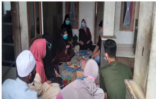
Gambar 1. Survei Awal Kondisi dan Potensi Lokasi Pelaksanaan PkM

Tahap awal kegiatan PkM dimulai dengan survei awal lokasi dan potensi daerah Kampung Pabuaran Hilir Desa Sukatani, Kecamatan Sukaraja, Kabupaten Bogor, Jawa Barat yang dilaksanakan pada tanggal 19 Juni 2021. Hasil survei awal menunjukkan tingginya minat masyarakat dalam membuat dan mengembangkan usaha pembuatan hand sanitizer dengan memanfaatkan peralatan sederhana. Dokumentasi kegiatan survei awal dapat dilihat pada Gambar 1.