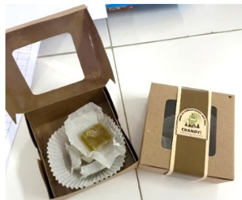
Gambar 1. Permen jeli kombucha daun sirsak yang telah dikemas

Bahan utama pembuatan permen jeli adalah kombucha daun sirsak. Selama pembuatan kombucha, terjadi proses fermentasi sukrosa oleh mikroorganisme yang menghasilkan asam organik, yang menurunkan pH larutan (Saputra dkk., 2017).